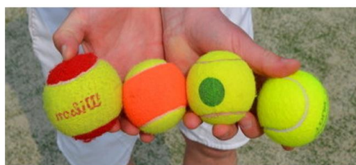
Ballen v.l.n.r.: rood – oranje – groen – geel

Rood, t/m 8 jaar: De categorie Rood speelt met kleine mobiele netjes overdwers op de baan. Er wordt gespeeld met een “rode” bal, deze is iets groter dan het normale formaat en stuit minder hoog. Rood kan ook over het gewone net spelen en het speelveld is dan het servicevak. Korte wedstrijdjes tot 7 punten (telling 1-2-3 enz). Rood is onderverdeeld in Rood 2 – beginnende spelers en Rood 1 – de iets meer gevorderde spelers.